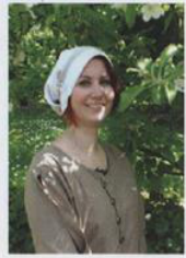
"Torwächters lieblich Töchterlein"